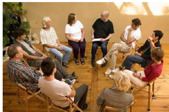
GRUPPI DI AUTO-MUTUO AIUTO