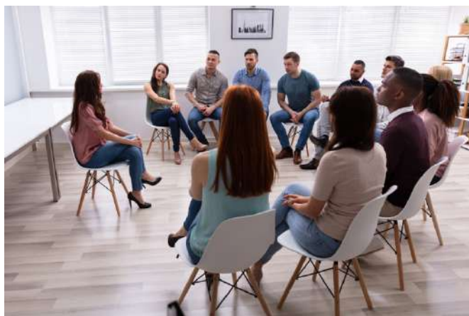
GRUPPI DI FORMAZIONE-INFORMAZIONE