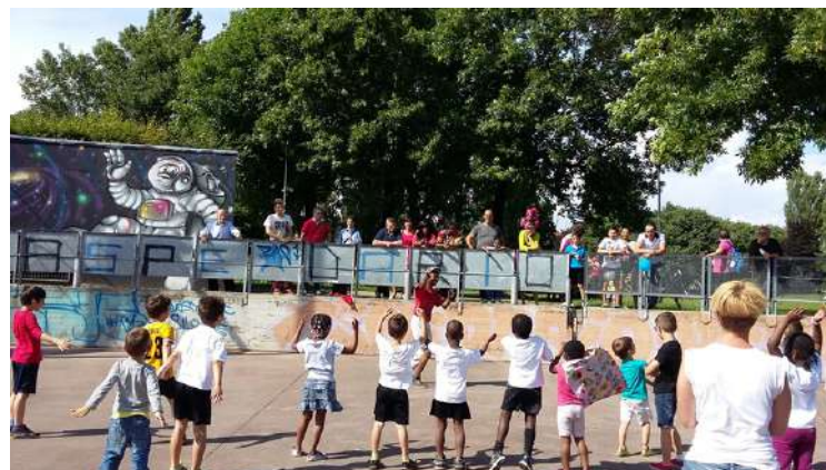
GRUPPI ANIMATIVI RICREATIVI