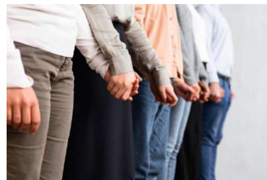
U.F.E: GRUPPI DI UTENTI E FAMILIARI ESPERTI